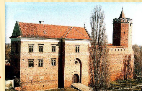
Muzeum w Łęczycy, Zamek Królewski